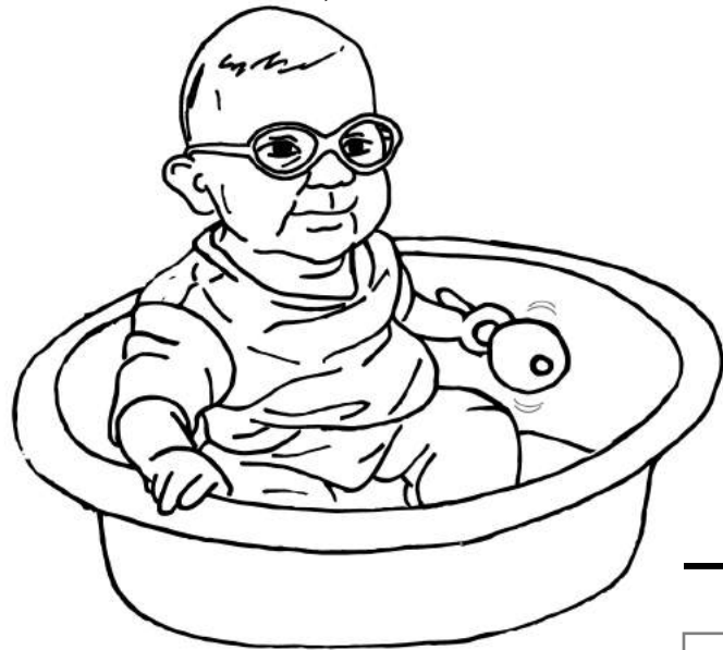
Niño pequeño con anteojos sentado en un valde grande con un juguete de fácil alcance; niño sosteniendo y sacudiendo una sonaja.

Me gusta jugar con cosas en y alrededor de mi hogar. Por favor tenga los juguetes cerca de donde los pueda alcanzar. Yo especialmente disfruto jugar con otros niños. Me gusta cuando mis hermanas juegan cerca, y me gusta unirme a ellos.