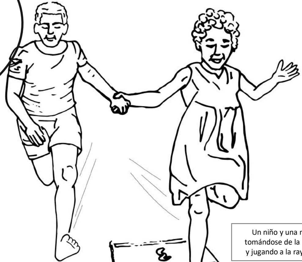
Un niño y una niña tomándose de la mano y jugando a la rayuela.